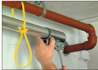
SpeedyTie® ist für die temporäre, aber starke Befestigung besonders geeignet.