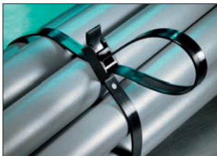
SpeedyTie® – Schnell und einfach.