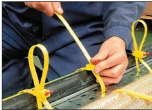
Die Bandenden lassen sich besonders unkompliziert zurückschlaufen.