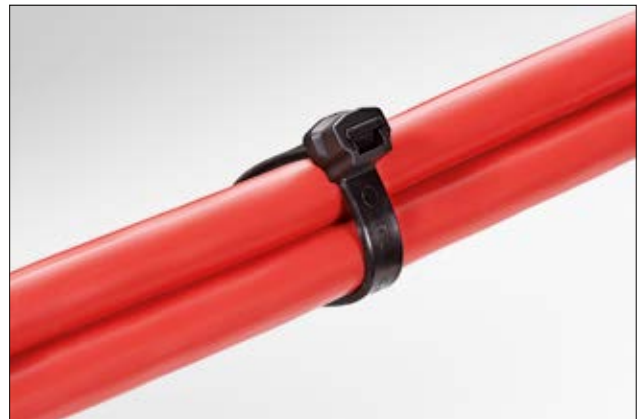
Das spezielle Kopfdesign der Z-Serie eignet sich besonders für Anwendungen mit hohen mechanischen Belastungen.