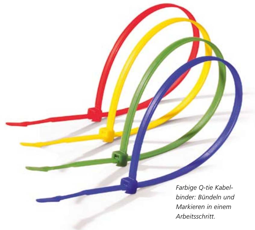
Farbige Q-tie Kabelbinder: Bündeln und Markieren in einem Arbeitsschritt.

Den Kern dieser neuen Produktserie bilden die Q-tie Kabelbinder. Der offene Binderkopf ermöglicht ein besonders leichtes Einschlaufen, selbst unter schwierigsten Arbeitsbedingungen. Das Sortiment umfasst unterschiedliche Materialien, Farben und Größen.